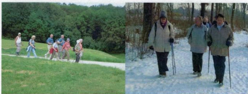
Wir wandern zu jeder Jahreszeit

Für Senioren ist Bewegung im Freien die beste Medizin. Zu Fuss lernen wir unsere engere Heimat noch besser kennen. Das gesellige Beisammensein schützt vor Vereinsamung. Es besteht kein Zwang zum Mitmachen, eine Anmeldung ist nicht nötig. Auch hat sich herumgesprochen, dass wirklich alle herzlich willkommen sind, keine(r) sich ausgeschlossen zu fühlen braucht. Neue Wanderer sind herzlich willkommen. Dies sind Trümpfe, die das ZAK-Team bewegen, das Wanderprojekt auch in Zukunft anbieten.