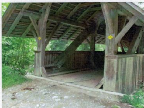
Brücke im Bumbach - bei der Wanderung vom 22. Juli 2011 überschritten.